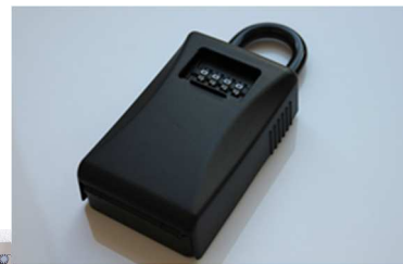
鍵の受け渡しは鍵箱を利用！電話1本でいつでも内覧可能です！

只今、「0円入居」キャンペーン実施中！ サービスルームはお部屋として使うと3LDKに！