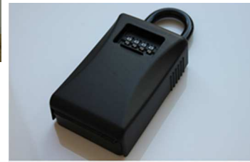
鍵の受け渡しは鍵箱を利用！電話1本でいつでも内覧可能です！